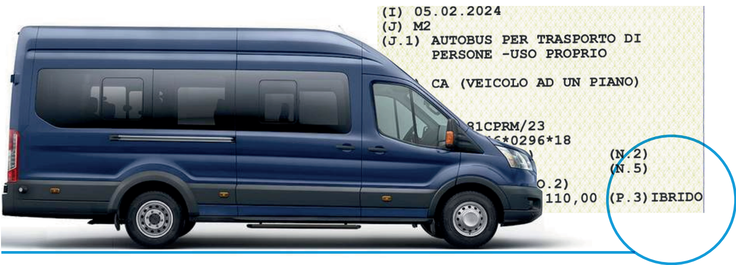
MINIBUS / NAVETTE / SCUOLABUS / VEICOLI COMMERCIALI

IL KIT GV MILD-HYBRID È GIÀ STATO INSTALLATO SU VEICOLI DA 3,5 A 7 TON